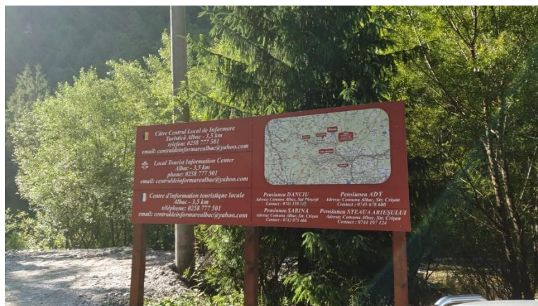
Panouri indicatoare pentru orientare turistică